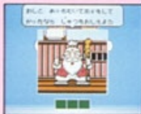
② あっちむいてホイ