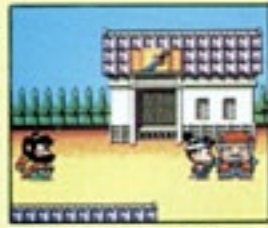
話したい人の前に

村人たちはいろいろな情報を知っている。村に入ったら、全員に話を聞いてみよう。意外とゲームを解くヒントを教えしてくれるかもしれないぞ。村人と話をするには、話したい人の前に立って(写真19)、十字ボタンの上を押そう。じぞうに話しかけるときの操作は同じだよ。