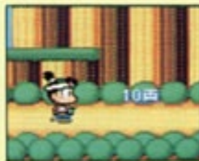
14 オニをこらしめろ