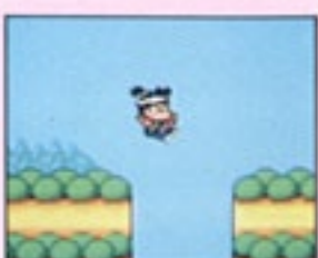
⑫ 基本はジャンプだ