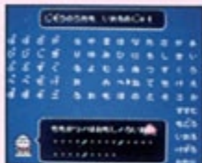
26 じぞうのうた入力