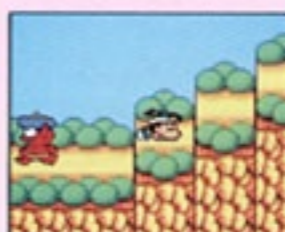
⑩ しゃがんでよけれ