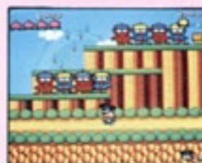
⑨ 右と左に歩けるぞ