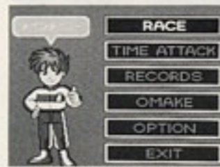
▲メインセレクト画面

PUSH RUNと出た後RUNを押すと「メインセレクト画面」になります。ここでは以下の好きなメニューを選ぶことができます。方向キーで好きなメニューを選び、①かRUNで決定してください。