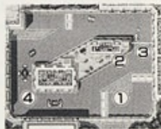
▲ハンドルタイプ1マーク (◆)

*ゲームが開始された時点でハンドルタイプはタイプ1です。SELECTを1回押すとタイプ2になり、もう1度押すとタイプ1にもどります。